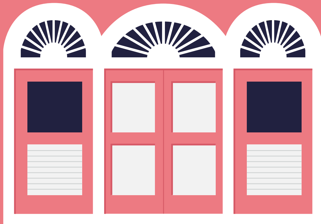
Arquitectura Popular Dominicana.